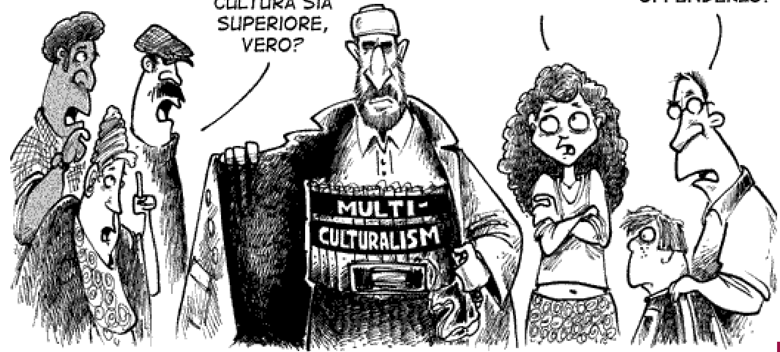
LA VERA BOMBA SUICIDA

E' ARROGANTE PENSARE CHE LA NOSTRA CULTURA SIA SUPERIORE, VERO?